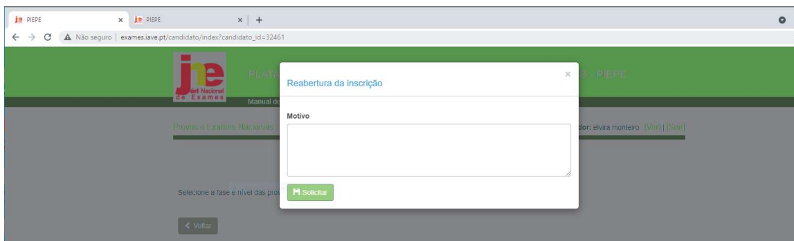
Figura 3 – Indicar o motivo do pedido de reabertura da inscrição